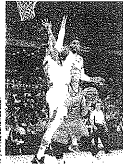
Domantas Sabonis (con el balón) anotó siete puntos.